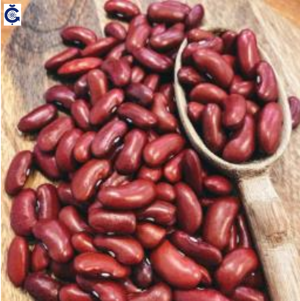
Granel Alubia Morada alargada de León. ECO