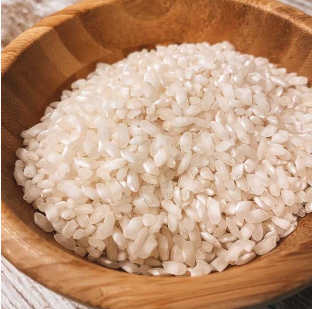
GRANEL ARROZ BLANCO REDONDO ECO