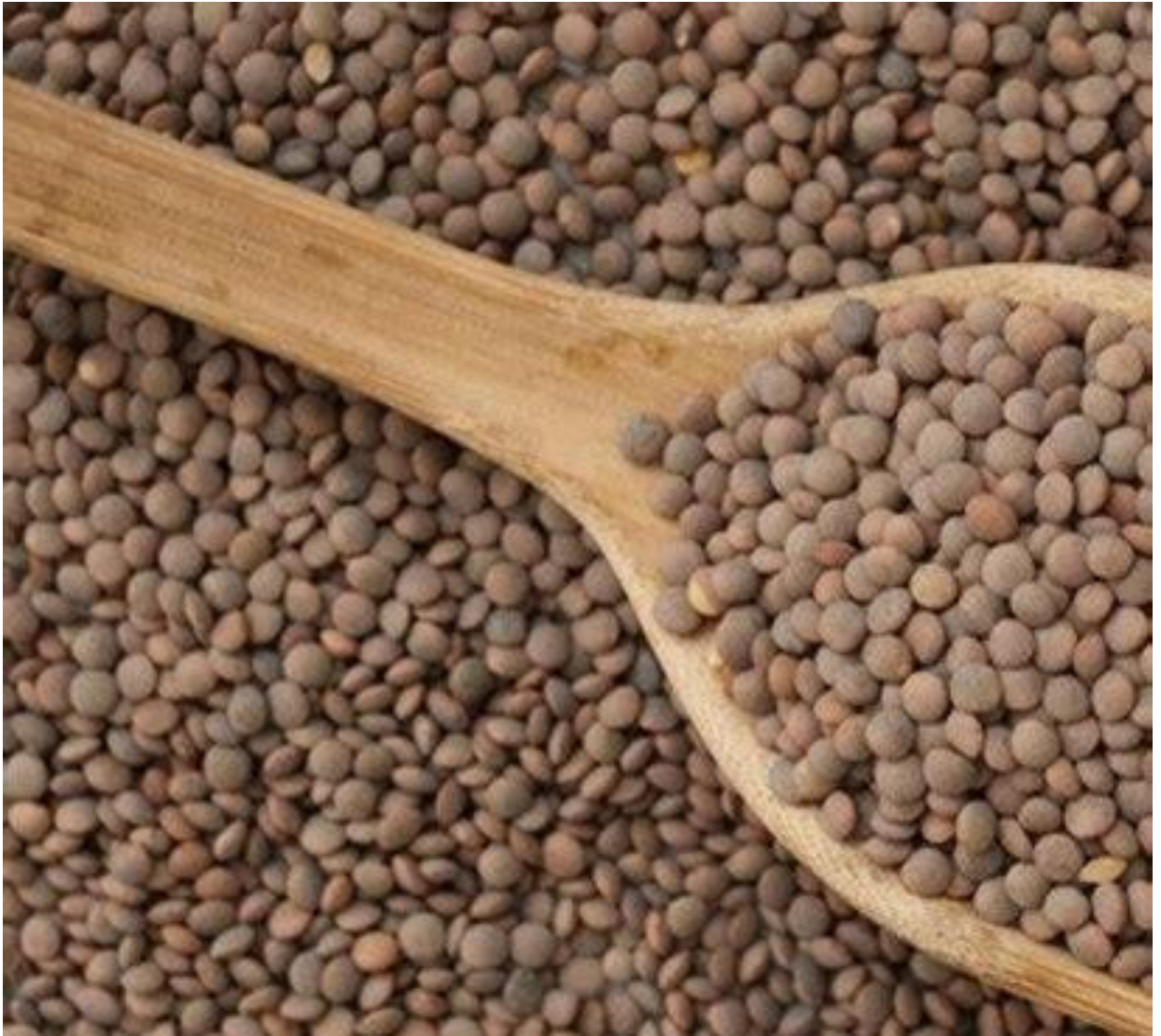
GRANEL LENTEJA PARDINA ECO