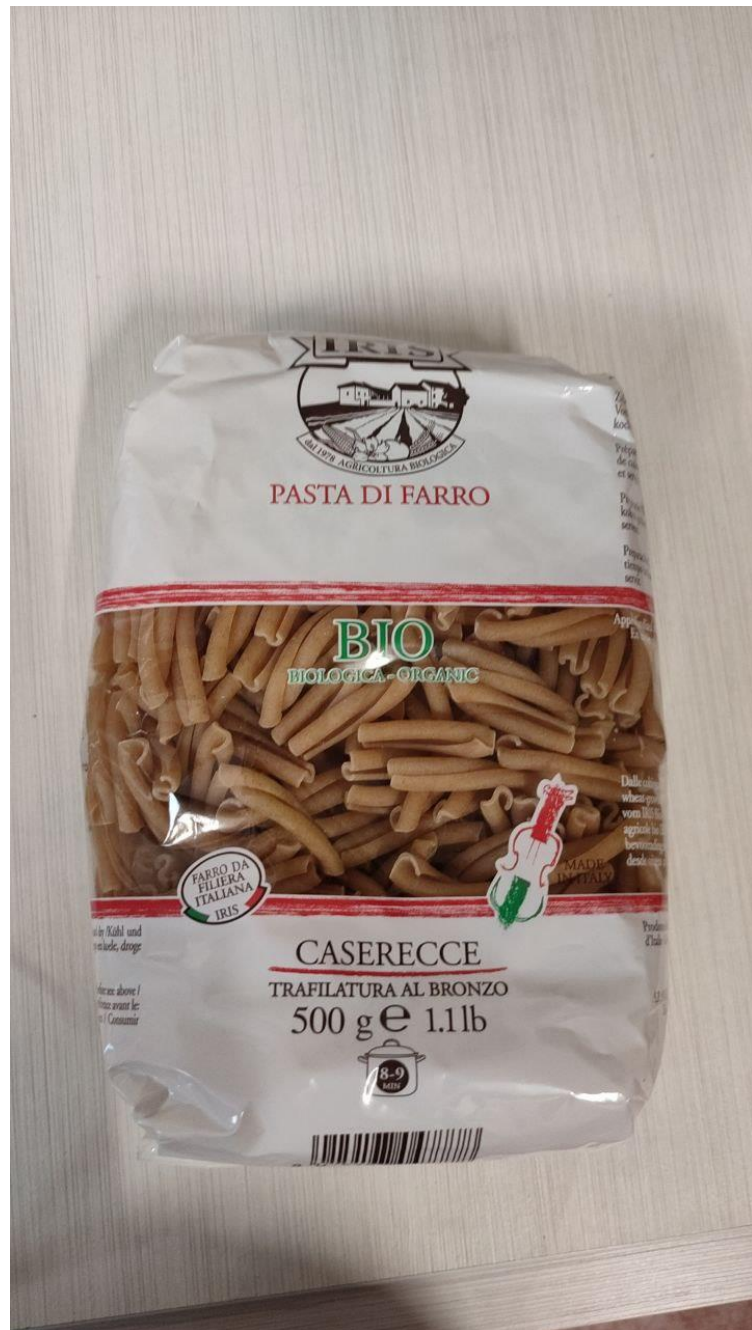
Pasta italiana Caserecce de espelta ecológica 500 gr