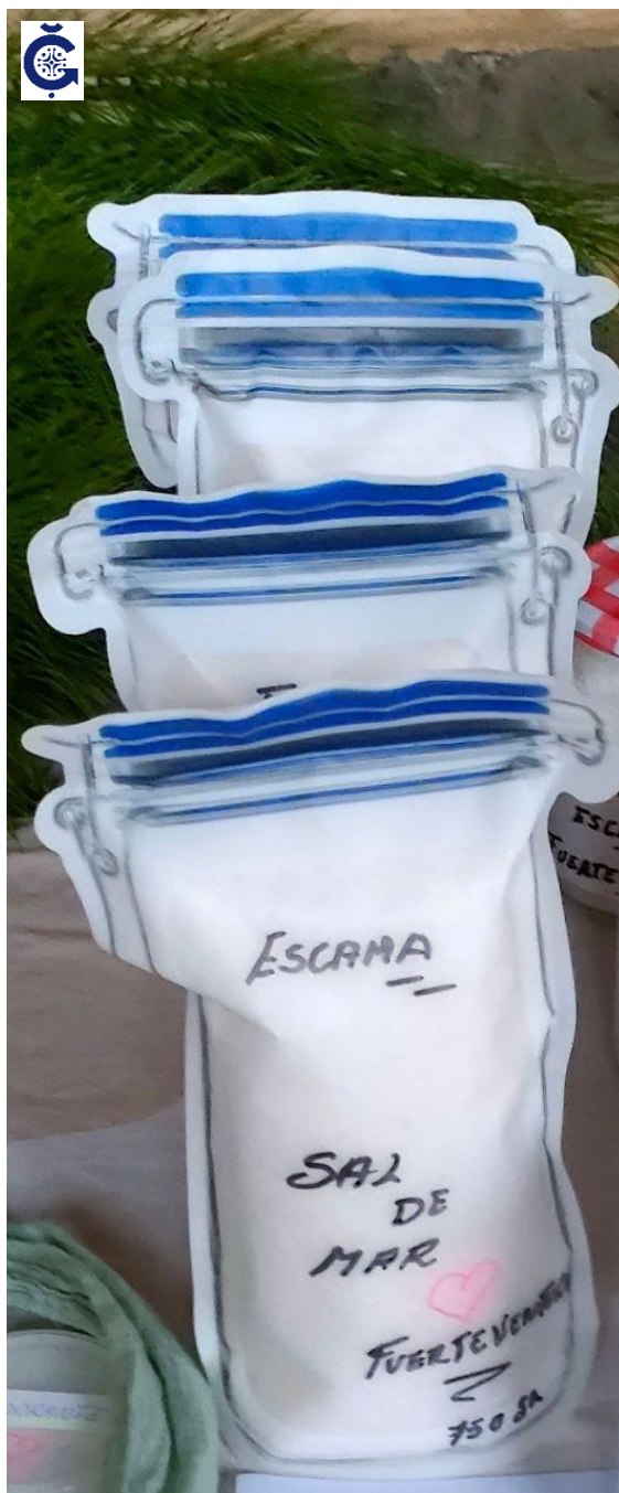
Escamas de sal de Fuerteventura 350 gr [artesanal]