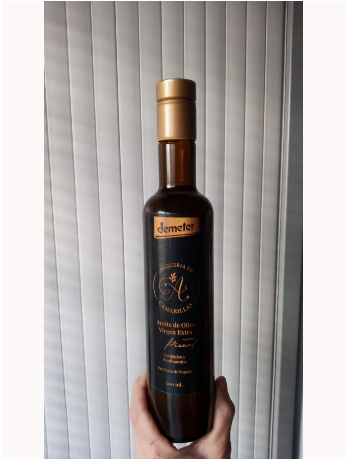
ACEITE BIODINAMICO CAMARILLAS, PICUAL 500 ml