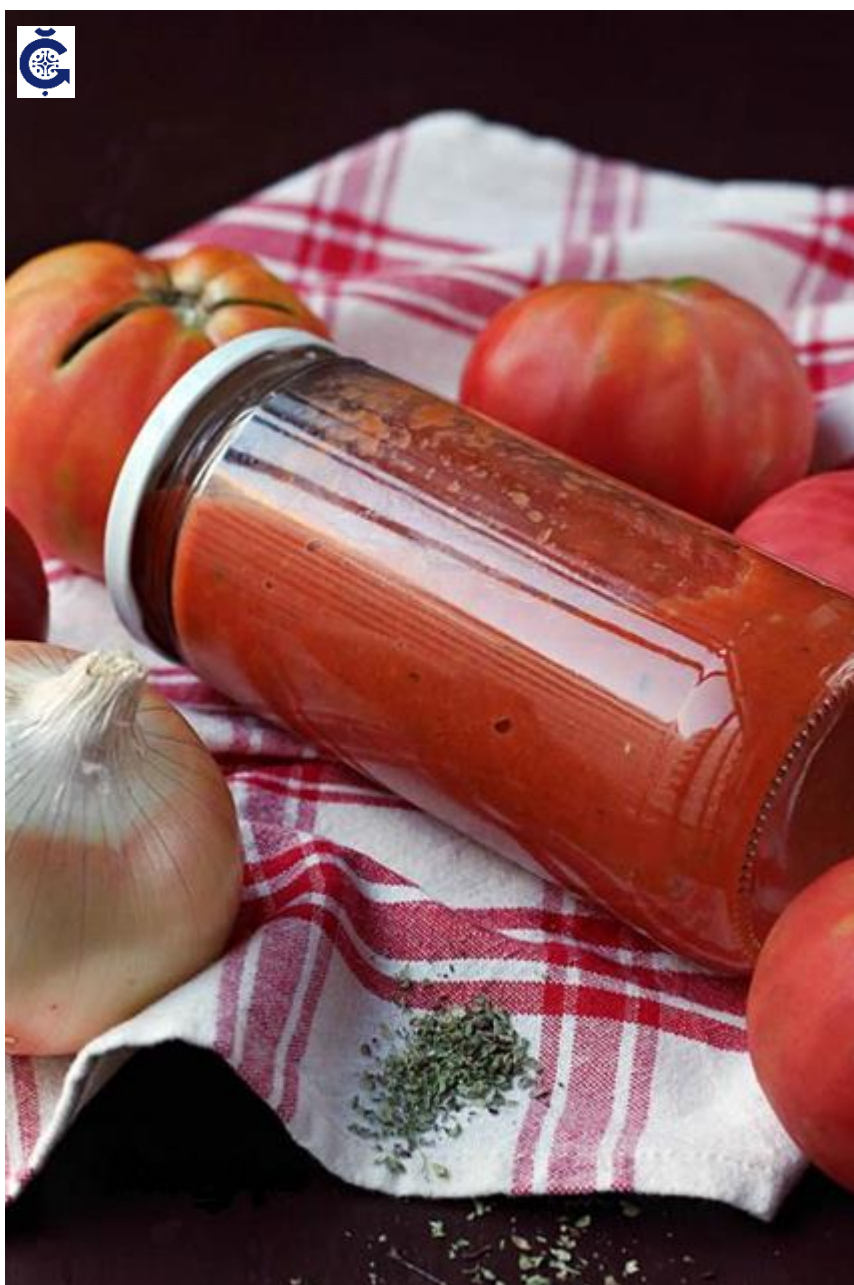
Tomate frito eco 445 gr [artesanal]