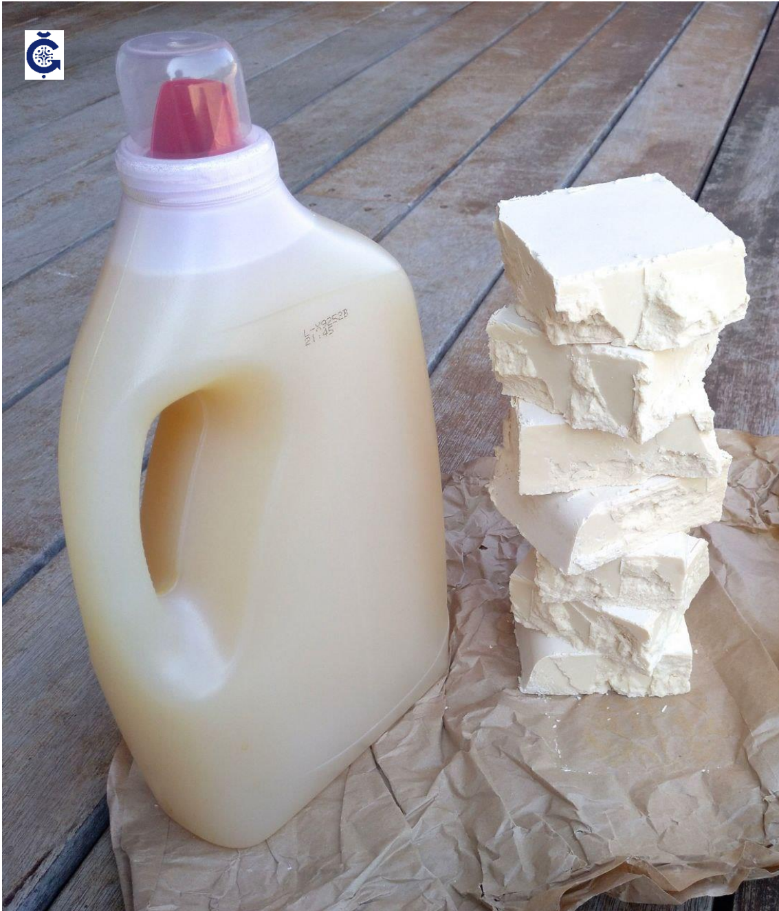
Jabón de lavadora GRANEL [artesano]