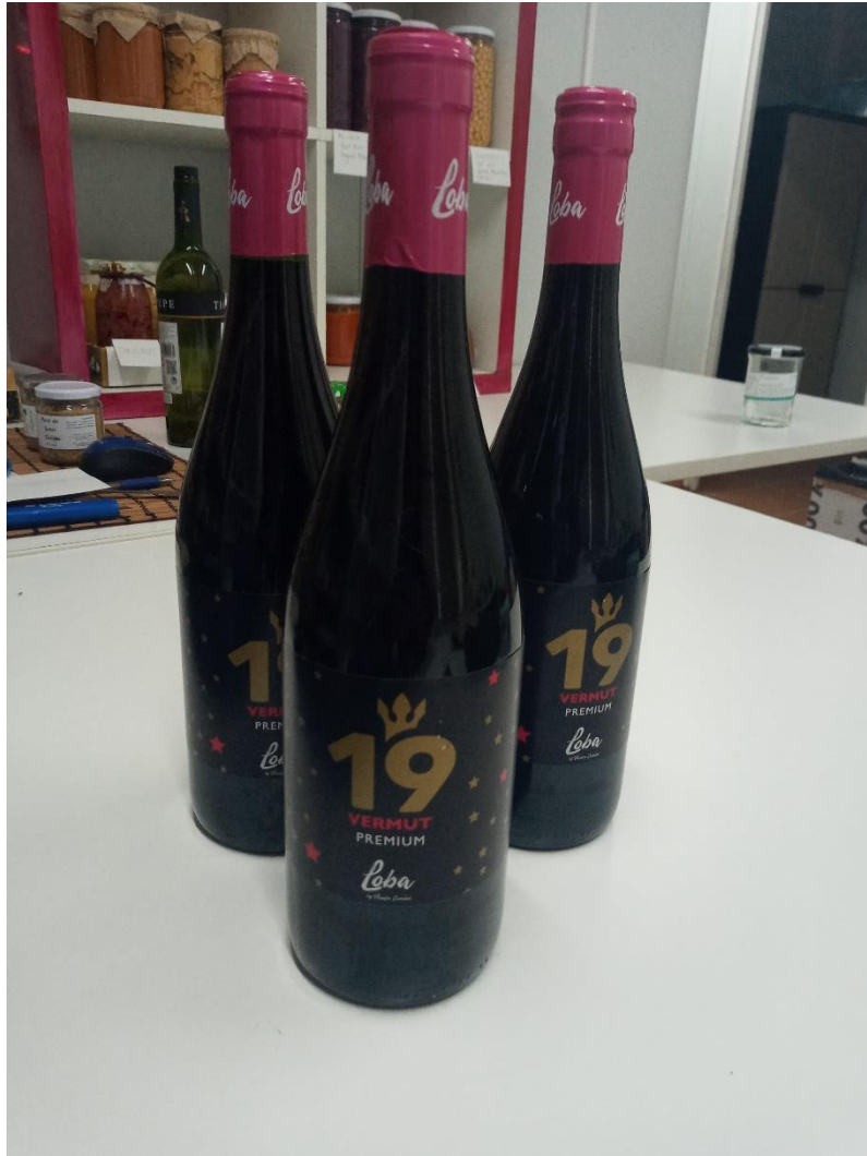
VERMUT PREMIUM LOBA 750 ML