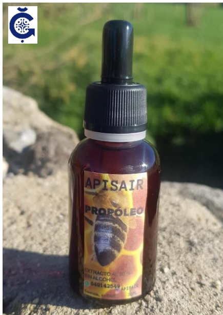
Propóleo extracto al 30 % sin alcohol