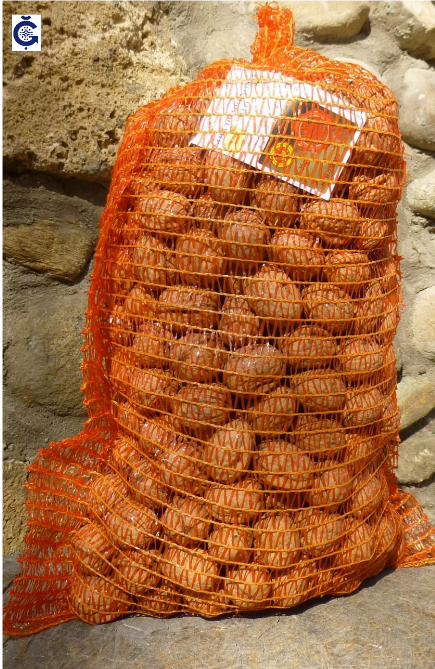
Nueces a granel