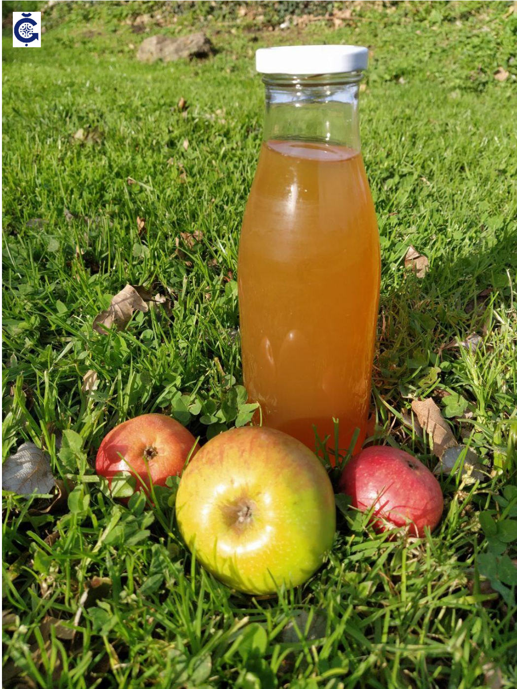
Zumo de manzana BIO 750 ml [artesanal]