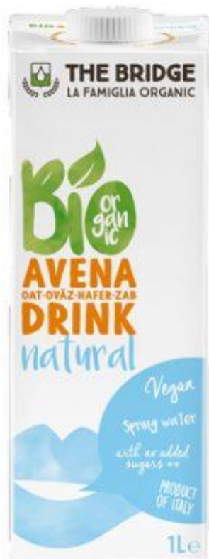
BEBIDA AVENA 1L 'TB' ECO