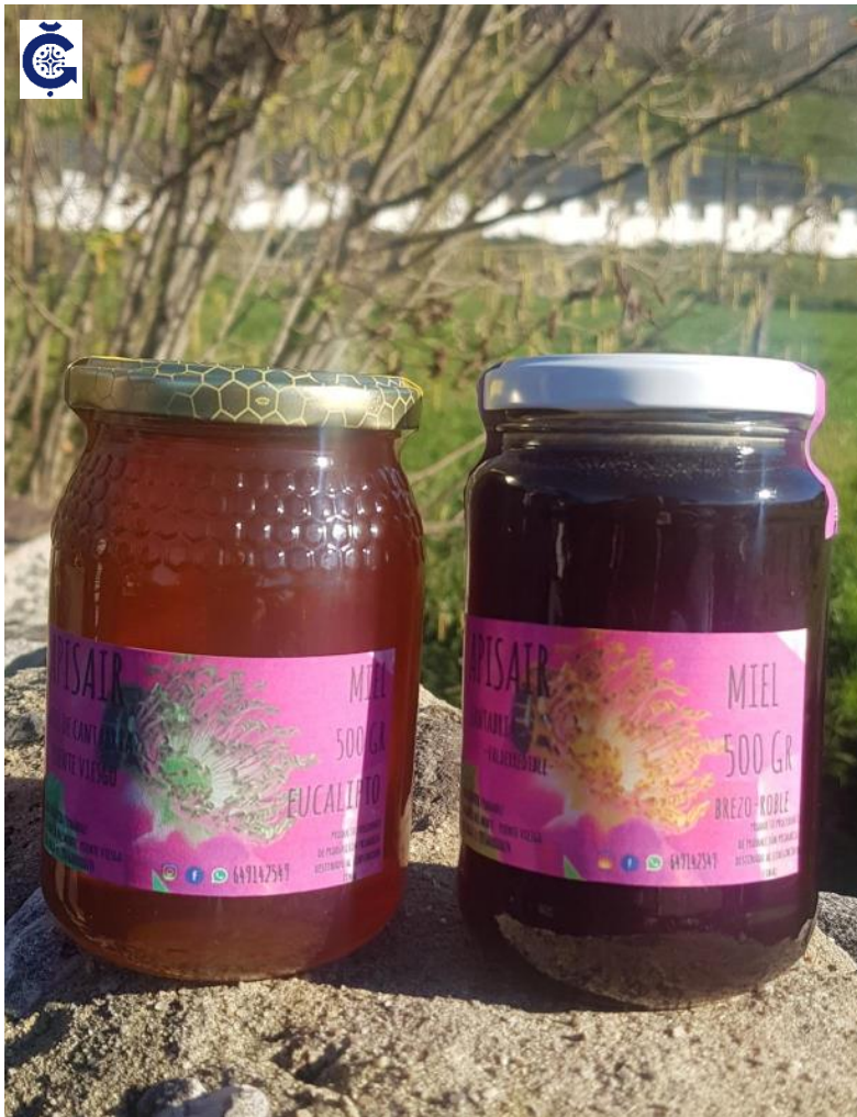
Miel de eucalipto y brezo 500 gr [artesanal]