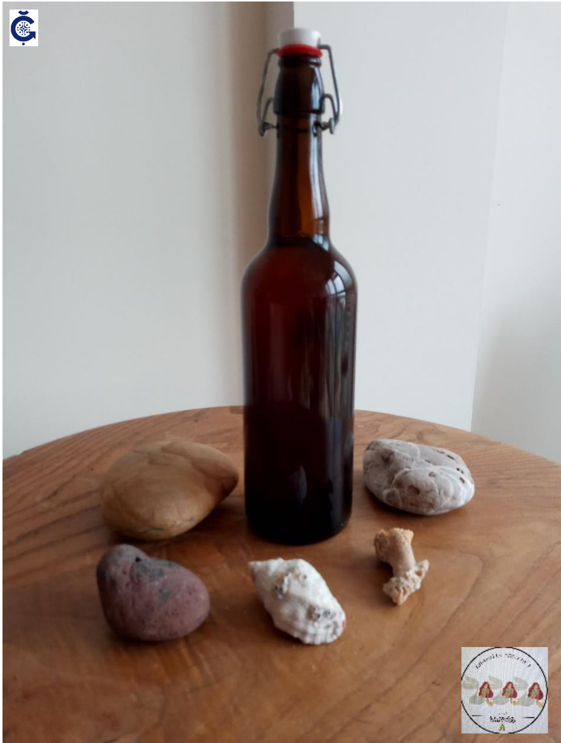
Cerveza artesana "Las Tres Sirenas" 750 ml y 33 ml