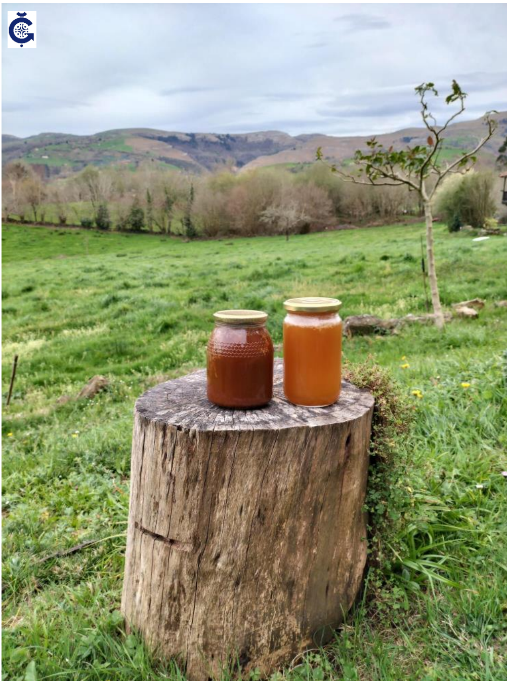
Miel de brezo y eucalipto 1 kg [artesanal]