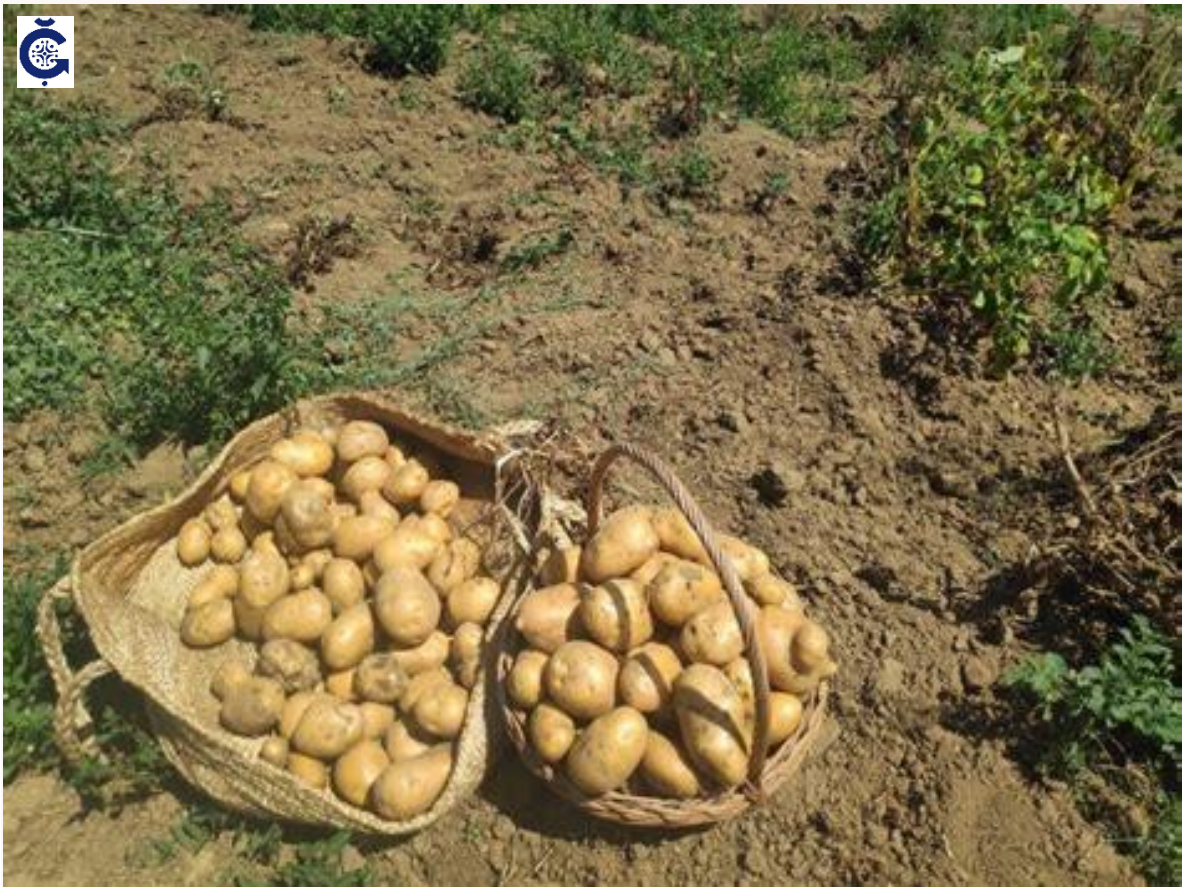
Patata de Valderredible a granel