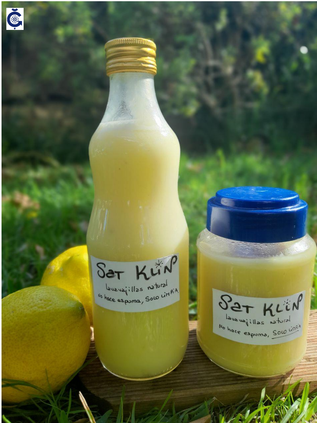
Limpiador anti cal de limón 400 ml [artesano]