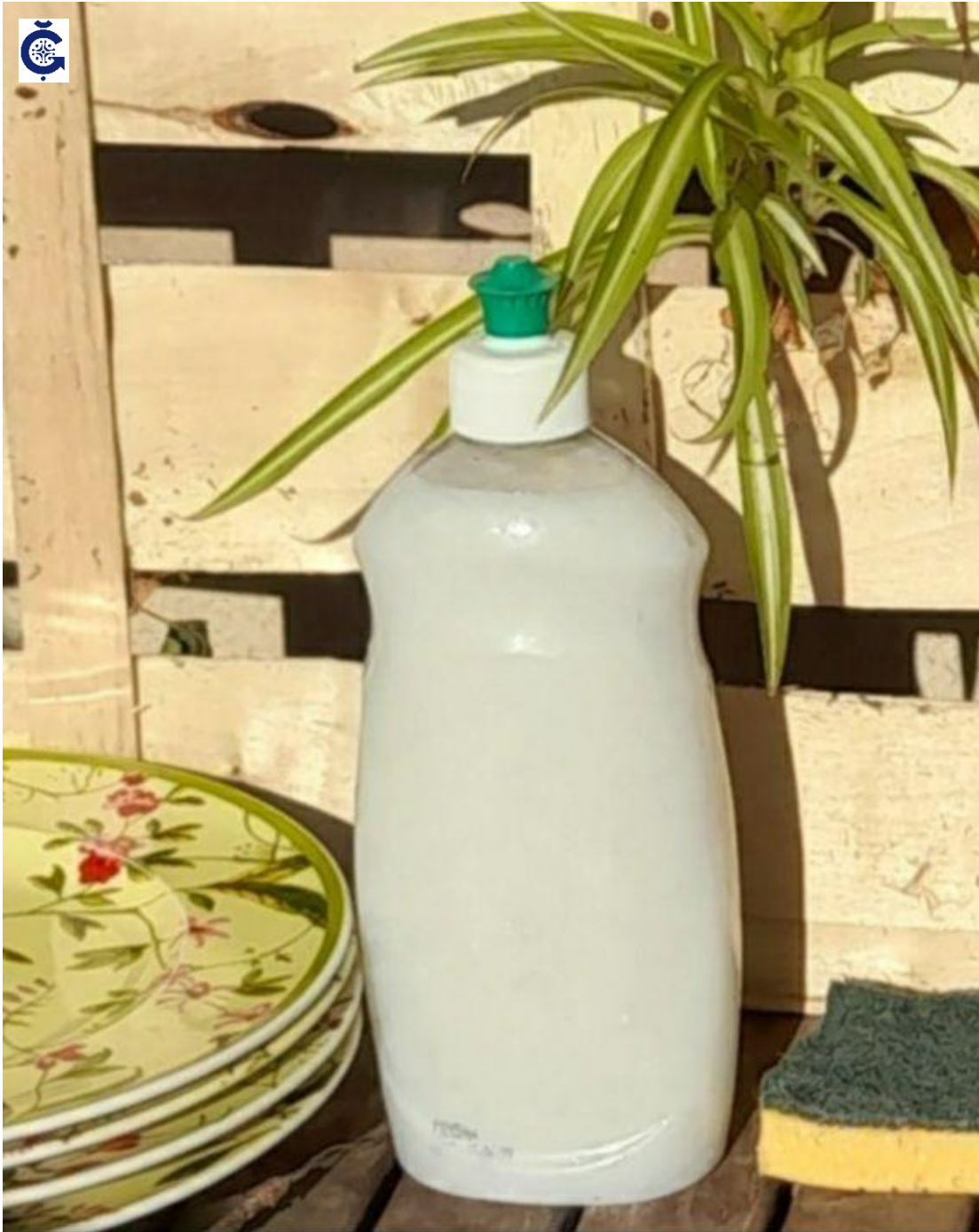
Jabón lavavajillas a mano 500 ml [artesano]